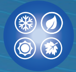
Isolation 4 saisons